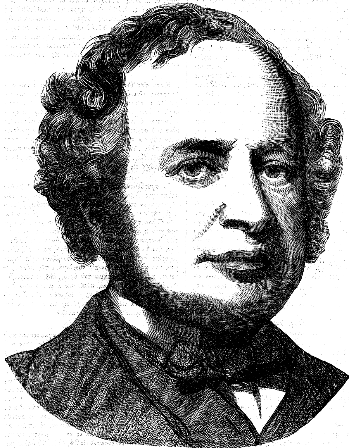
Ο ΚΟΜΗΣ ΓΡΑΝΒΙΑ

'Αγάπα τὸ σκυλάκι σου καὶ θάλθουν ἄλλοι χρόνοι, Νὰ 'θυμηθῆς τὰ λόγια μου, τὸν κόσμο σ' ἂν γνωρίσης, Σ' ἂν σοῦ 'ματώσουν τὴν καρδιά, καὶ τὴν πληγώσουν πόνοι, Αἱ φίλαις σου π' ὀλόψυχα ταῖς εἶχες ἀγαπήσεις. Κάλλιο μονάχη κόρη μου, μὲ τὸ πιστὸ σκυλάκι, Πόσοι δὲν εἶναι φίλοι μας ποῦ στάζουνε φ α ρ μ ἁ κ ι ! Ν. Γ. ΙΓΓΑΒΗΣ.